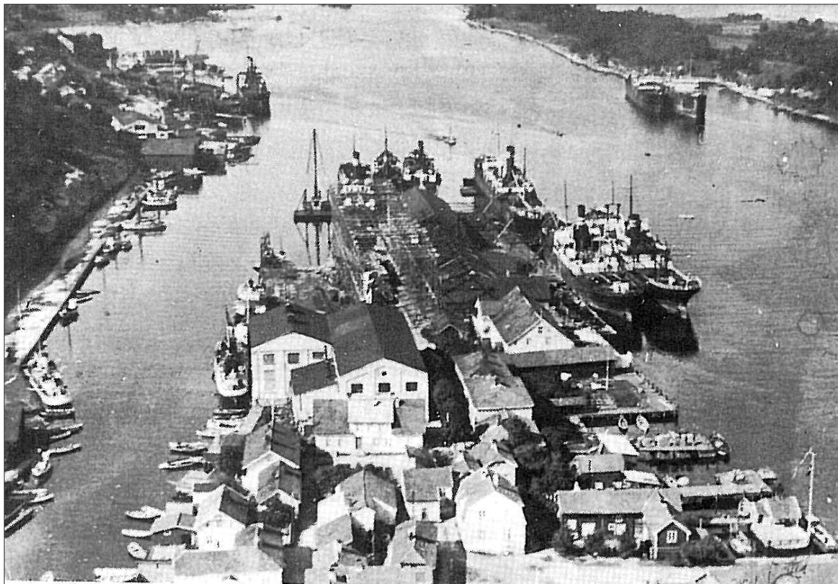
Kroken. Bildet, som er tatt i 1931, viser bl.a. Smitangen med Langesunds Mek. Verksted og bebyggelsen i Kroken. I sundet og ved kaiene ligger skip i opplag.

fører ut til Klamradalen, var en fulltreffer. Navnet ble Karen Sundts vei. Her hadde hun gått så mange ganger, og i slutten av hennes fortelling finner vi den sinnsforvirrede datterdatter til kommandanten hvileløst vandrende "i den naturskjønne Klammerdal plukkende salvie og sankende opp de gule konkylier som havet har skillet innover stranden".