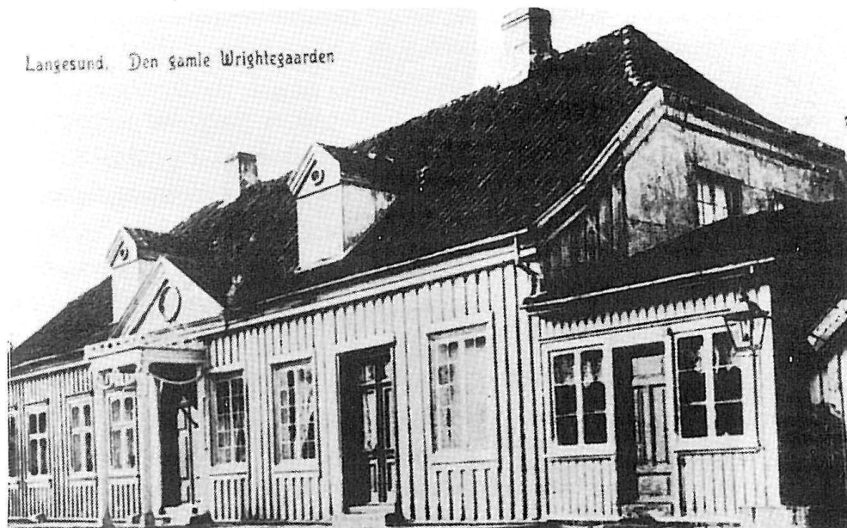
Gammelt bilde av Wrightegaarden.

bøker, men for de fleste barna var det meget smått med lommepenger, og bokkjøp var en sjeldenhet. I en omkrets av knapt 100 meter fantes to av Langesunds elleve kolonialforretninger; Wissestads butikk i den lave enetasjes bygningen (revet) i nordkanten av torget, der det nå er oppstillingsplass for busser, og Petter Eriksens kolonial og skipshandel i bygningen på sørsiden av Cudrios sjøbod.