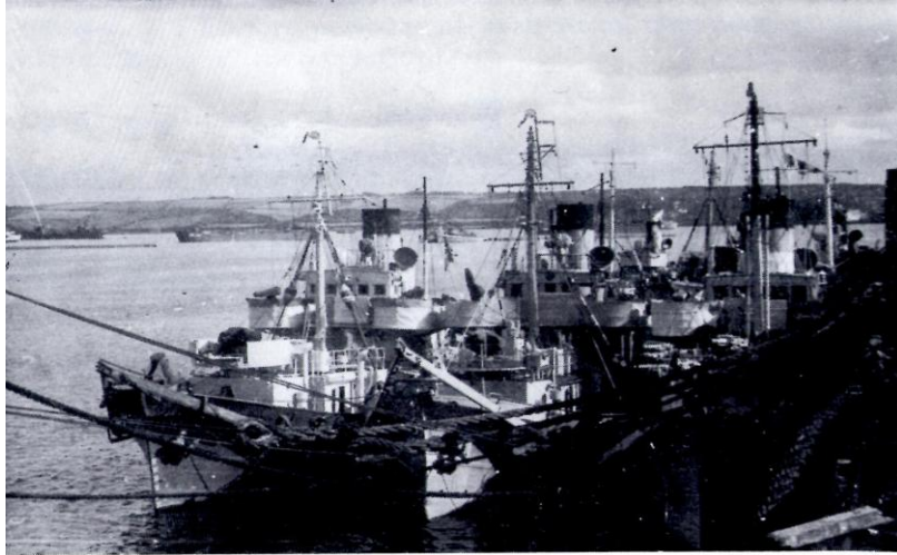
''BREVIK'', ''DRØBAK'' og ''HARSTAD'' * ved kai i Plymouth