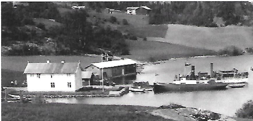
Passasjerbåten "Dølen" og slepebåten "Fram" ved brygga der Fjone landhandel låg.

Tømmertransporten var viktigst. Men en dag i uken var satt av til passa-